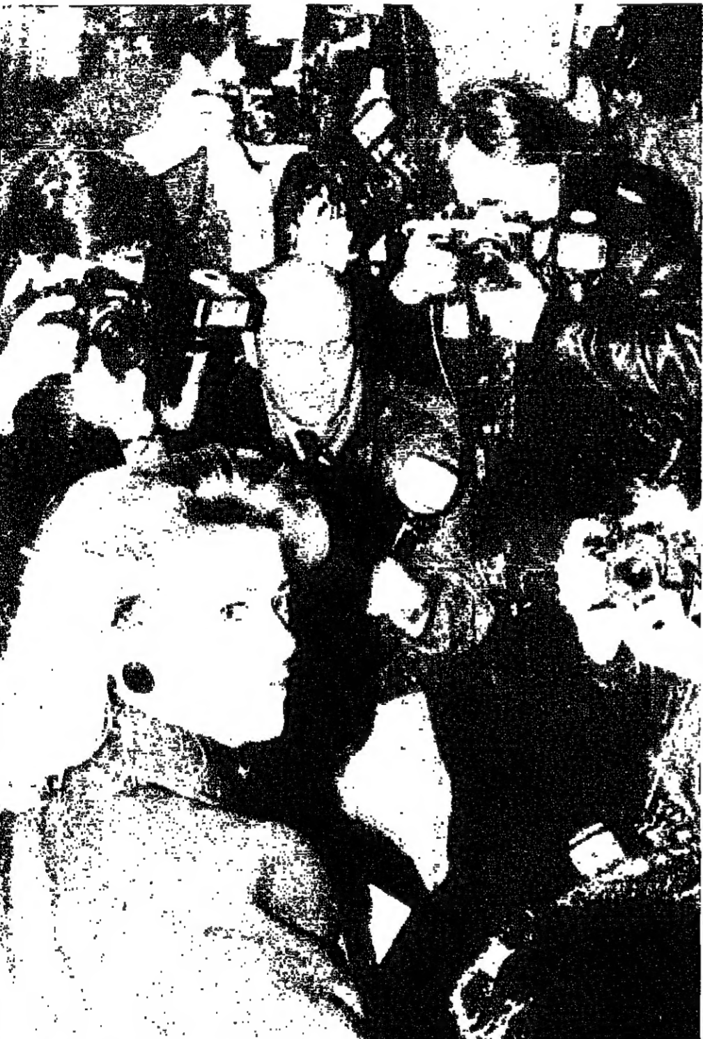
امس الاول . انها الممثلة الفرنسية الساحرة كاترين دونوف . اثناء حضورها عرض مجموعة ازياء ايف سان لوران . باريس - ر